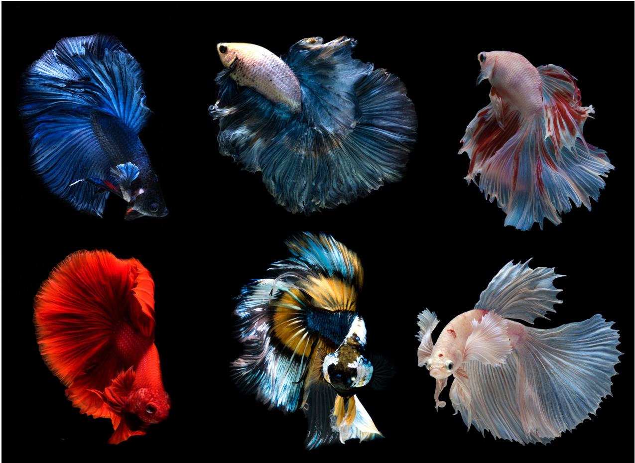
Los peces Betta, Betta Splendens , o pez luchador siamés, son una de las especies más demandadas hoy día, gracias a su longevidad, su fácil mantenimiento y la colorida espectacularidad de las colas y aletas de los machos.

- Cada vez más, pero hay que decir que no todos los profesionales se lo saben dar. Ha mejorado enormemente pero todavía queda bastante trabajo por hacer.