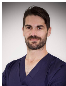
Por Fernando S. Reina Rodríguez VETERINARIO

En el caso de las patologías uterinas, una de las más frecuentes es la infección o piómetra. La posibilidad de que una perra adulta no esterilizada desarrolle una infección uterina es de aproximadamente un 25%. La enfermedad puede manifestarse con una descarga vaginal purulenta, aumento del consumo de agua y frecuencia de la micción, apatía y pérdida del apetito. Sin embargo, aunque los síntomas no parezcan alarmantes la enfermedad puede causar desequilibrios me-