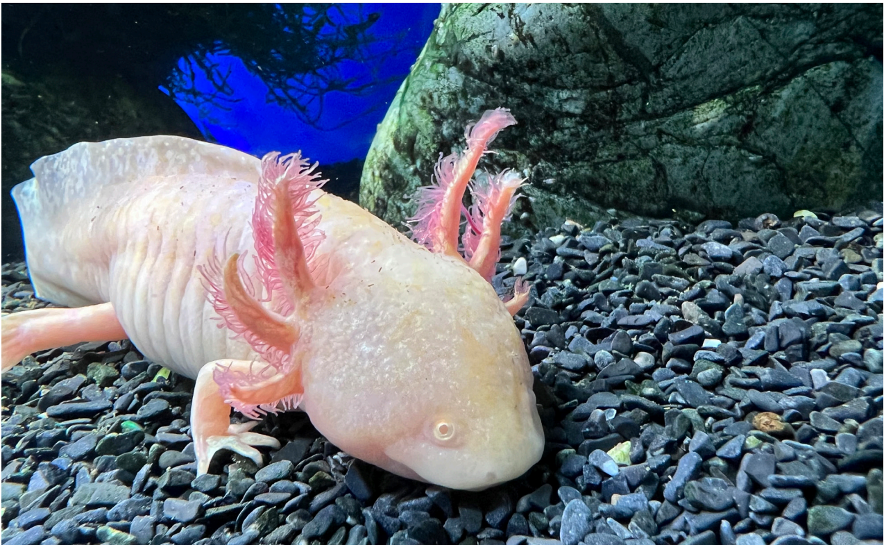
Los ajolotes suelen ser marrones y moteados, aunque son habituales y muy demandados los rosados. Los apéndices de su cabeza, donde se encuentran sus branquias, son de lo más llamativo de este animal.

- ¿Los clientes suelen buscar asesoramiento?