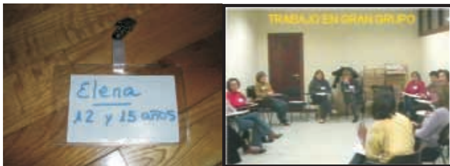
Imagen 6. Grupo de participantes en un programa de formación donde se aprecian los identificadores personales

Otro recurso que se sugiere utilizar es el papelógrafo, con su pliego grande de papel y rotuladores de colores, para que el coordinador de la sesión pueda escribir en él las ideas fundamentales que van surgiendo con la participación de todas las personas, tal como se aprecia en las Imágenes 7 y 8.